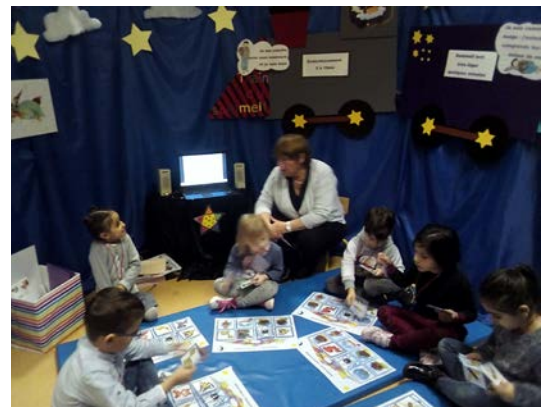
Forum sommeil à Roubaix Crédit illustration : VIF