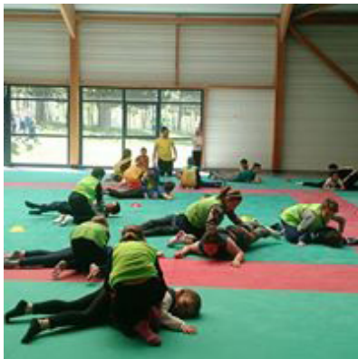
Séance d'initiation à l'activité physique à Valenciennes

Quant à la ville de Roubaix, elle s'est approprié la thématique en organisant un forum consacré au sommeil. Au programme : exposition de dessins, café-débat, défi lecture, ateliers pédagogiques... Durant huit jours, 282 enfants de maternelle et plus d'une centaine de parents ont été sensibilisés à l'importance du sommeil.